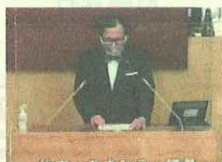
議会一般質問の議場