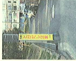
富士見町7丁目 交通安全改善 整備 (アフター)