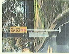
富士見町7丁目 交通安全改善整備 (アフター)