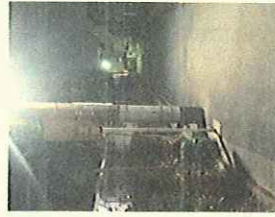
富士見町7丁目 交通箇所 (ビフォー)