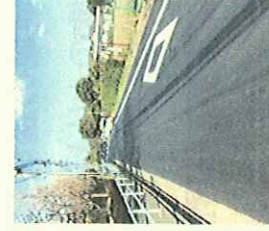
富士見町7丁目 6丁目付近 路面改善整備 (アフター)